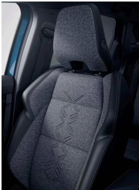
Fekete műbőr- és szürke szövet üléskárpit