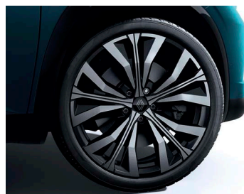
20" könnyűfém EFFIE keréktárcsa