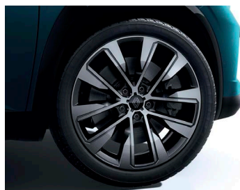
19" könnyűfém KOMAH keréktárcsa