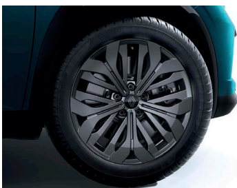
18" könnyűfém DIAMOND keréktárcsa