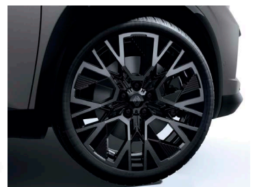
20" könnyűfém ESPRIT ALPINE keréktárcsa