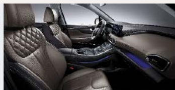
Bézs bőrbelső (SST)