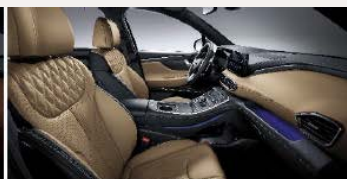
Camel bőrbelső (MMX)