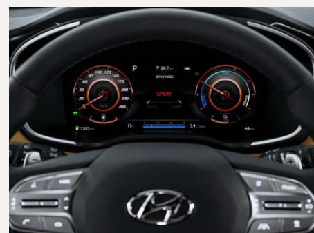
Supervision 12,3" TFT műszeregység