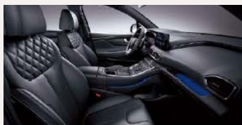
Fekete bőrbelső (NNB)