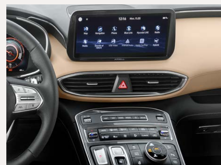
10,25"-os Navigációs rendszer és terep előválasztó