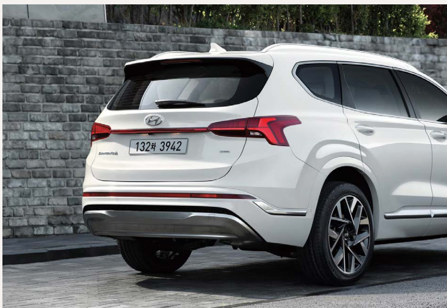
Dízel kivitel 20"-os alufelnikkel, Luxus csomaggal