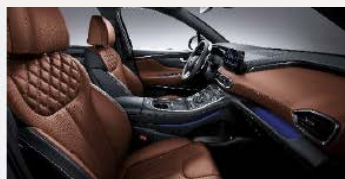
Cognac bőrbelső (NGN)