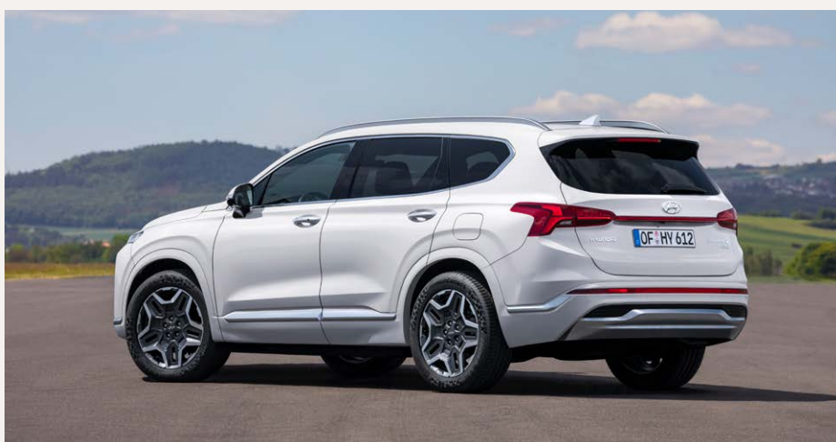
Hybrid kivitel 19"-os alufelnikkel, Luxus csomaggal