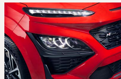
Full LED fényszóró - N-Line