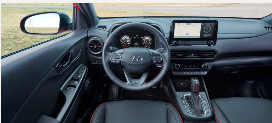
N-Line Belső megjelenés két 10,25"-os színes TFT kijelzővel