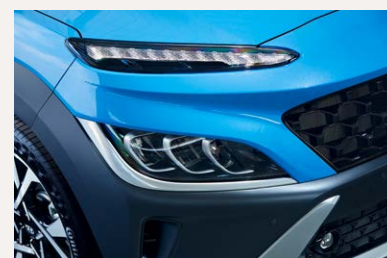
Full LED fényszóró