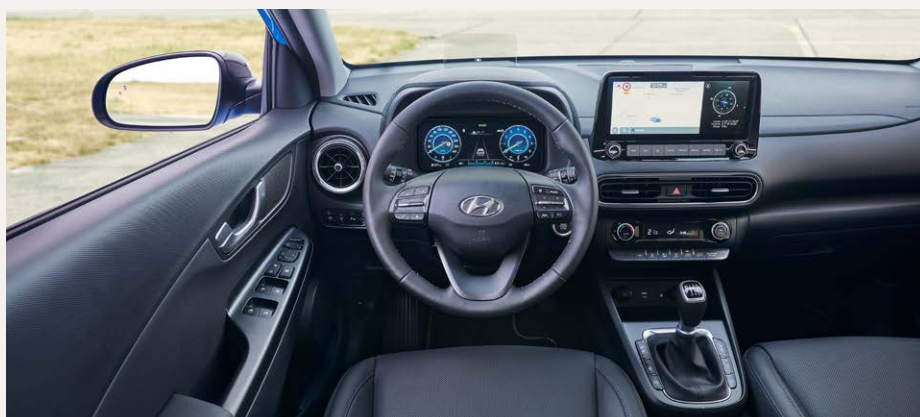
Belső megjelenés két 10,25"-os színes TFT kijelzővel