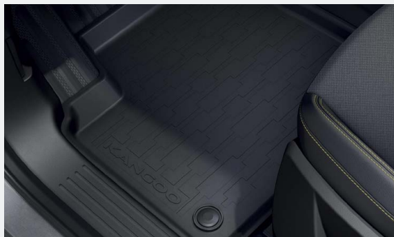
Hattyúnyakos vonóhorog, gumiszőnyeg