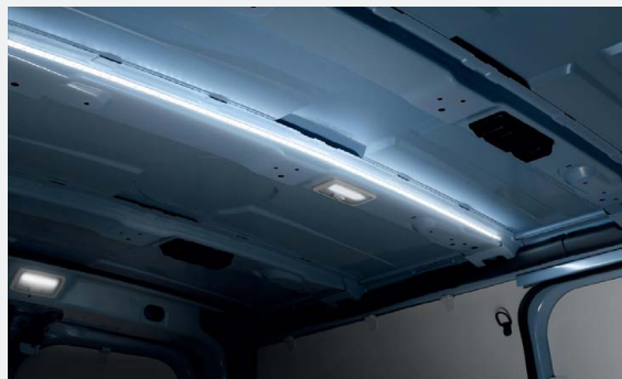
LED csomagtér világítás