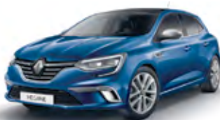
Ferrit kék (GT Line)