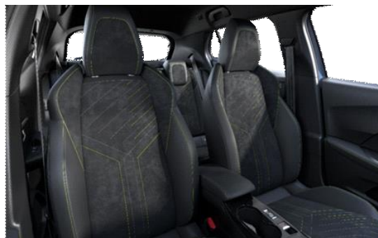
Alcantara ICONIUM kárpit 'adamite' díszvarrással GT opció