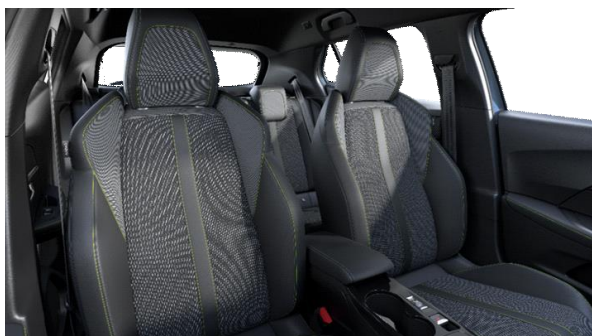
BELOMKA bőr-szövetkárpit 'adamite' díszvarrással GT széria