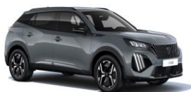
Selenium szürke (Széria)