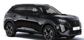
Perla Nera fekete