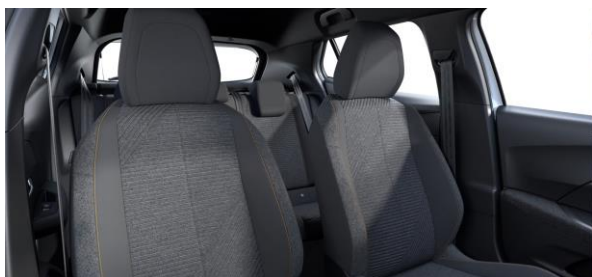
RENZO szövetkárpit "naplemente sárga" díszvarrással Style széria