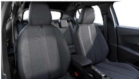
LOMSA szövetkárpit 'quartz' díszvarrással Allure széria