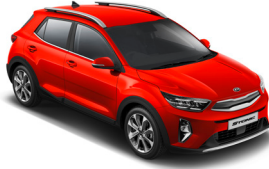
Signal Red (BEG) Metál