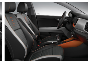
HÁROMTÓNUSÚ FEKETE-SZÜRKE- NARANCS SZÖVET STYLE felszereltséghez felár nélkül választható GOLD, PLATINUM felszereltségekhez "STYLE" csomagban (CCP)