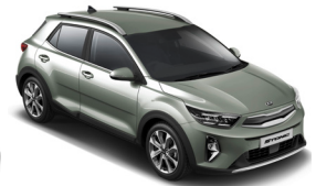
Urban Green (URG) Metál GT-Linehoz nem elérhető