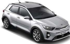
Silky Silver (4SS) Metál