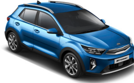
Sporty Blue (SPB) Metál