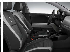
KÉTTÓNUSÚ FEKETE-SZÜRKE SZÖVET GOLD PLUS felszereltséghez sztenderd STYLE felszereltséghez felár nélkül választható GOLD, PLATINUM felszereltségekhez "STYLE" csomagban (ECP)