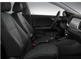
KÉTTÓNUSÚ FEKETE SZÖVET SILVER felszereltségekhez széria