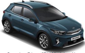
Smoke Blue (EU3) Metál GT-Linehoz nem elérhető