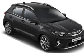
Aurora Black Pearl (ABP) Metál