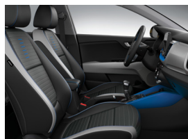
HÁROMTÓNUSÚ FEKETE-SZÜRKE- KÉK SZÖVET STYLE felszereltséghez felár nélkül választható GOLD, PLATINUM felszereltségekhez "STYLE" csomagban (GCP)