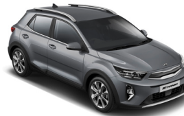
Perennial Grey (PRG) Metál