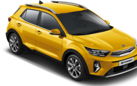
Most Yellow (MYW) Metál