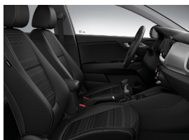
KÉTTÓNUSÚ FEKETE SZÖVET GOLD, PLATINUM felszereltségekhez széria