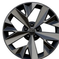
18" könnyűfém keréktárcsa Type B /XL/ (GT-LINE - HEV)