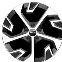
18" könnyűfém keréktárcsa Type A /XK/ (PLATINUM - ICE/HEV)