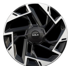
19" könnyűfém keréktárcsa Type A /XM/ (GT-LINE - ICE/PHEV)