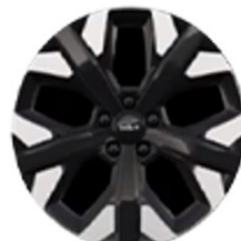
19" könnyűfém keréktárcsa Type B /XP/ (GOLD, PLATINUM - PHEV)