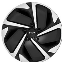
17" könnyűfém keréktárcsa Type B /VB/ (GOLD - ICE/HEV)