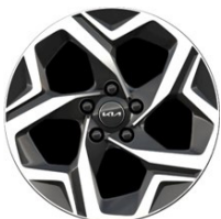
17" könnyűfém keréktárcsa Type A /VA/ (SILVER)