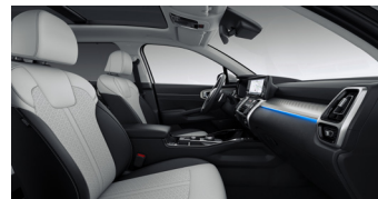
PLATINUM PRO opciós fekete/szürke kéttónusú bőr