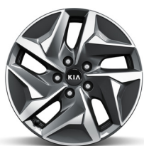
HEV 17" könnyűfém keréktárcsa