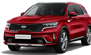
Runway Red (CR5) PRÉMIUM METÁL