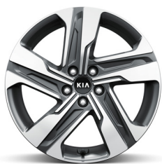
Dízel / HEV / PHEV 19" könnyűfém keréktárcsa