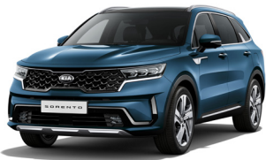
Mineral Blue (M4B) PRÉMIUM METÁL