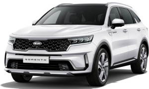
Clear White (UD)