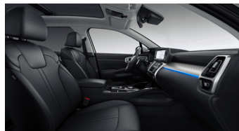
PLATINUM opciós fekete bőr