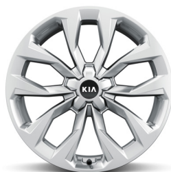
Dízel 20" könnyűfém keréktárcsa