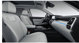
PLATINUM PRO opciós szürke bőr