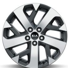
Dízel 18" könnyűfém keréktárcsa