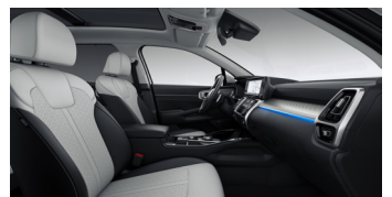
KRYPTONITE opciós fekete/szürke kéttónusú bőr