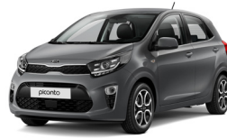
Astro Grey (M7G)