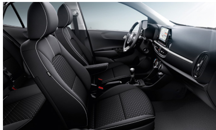
GOLD, PLATINUM fekete szövet