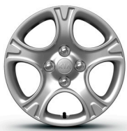
SILVER 14" acél keréktárcsa dísz tárcsával