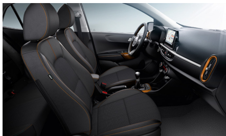
Opciós YELLOW csomag GOLD, PLATINUM felszereltségekhez