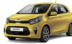
Honey Bee (B2Y)