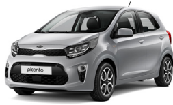
Sparkling Silver (KCS)