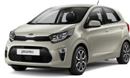
Milky Beige (M9Y)