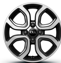
PLATINUM 15" könnyűfém keréktárcsa