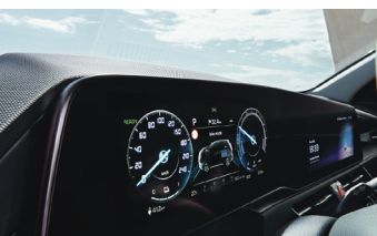
Fulldigitális műszeregység 10.25"