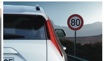
Sebességkorlátozást kijelző rendszer (SLIF)