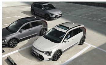
Parkolásiütközés-elkerülő asszisztens (PCA)