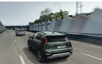
Navigációalapú adaptív tempomat Stop&Go funkcióval (NSCC)