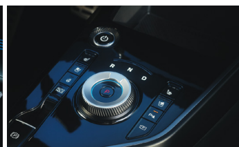
Menetirány előválasztó tárcsa