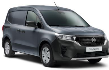
Szürke KPW - 70 000 Ft