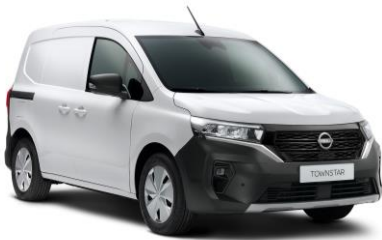
Fehér QNG - 0 Ft