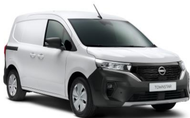
Fehér QNG – 0 Ft