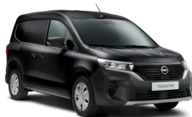
Enigma fekete GNE – 130.000 Ft