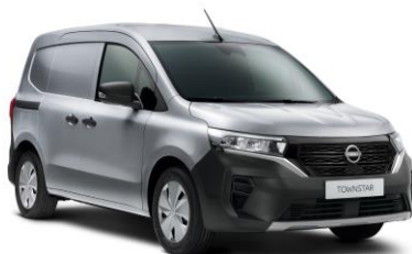
Gyöngyház szürke KQA – 130.000 Ft