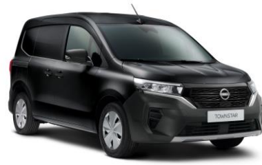
Enigma fekete GNE - 130 000 Ft