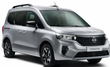
Gyöngyház szürke KQA - 130 000 Ft