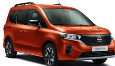
Terrakotta CNZ - 130 000 Ft