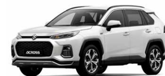
Platinafém gyöngyház (089)