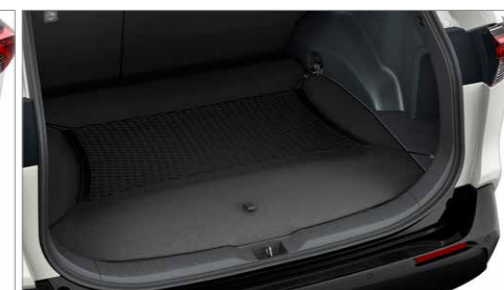
Csomagtérelválasztó háló – horizontális