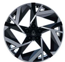
19" könnyűfém fekete-ezüst kéttónusú ELIXIR keréktárcsák