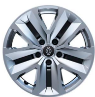
17" acél keréktárcsák NYMPHEA díszlámpákkal (FlexWheel)