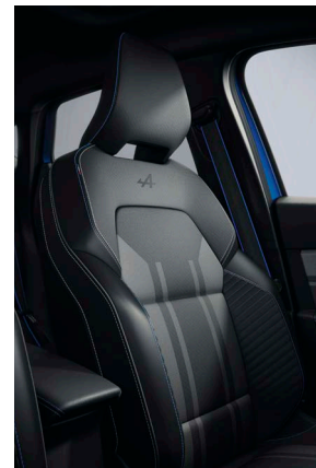
esprit Alpine kárpitozás kék varrással