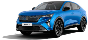
Matt Alpine kék