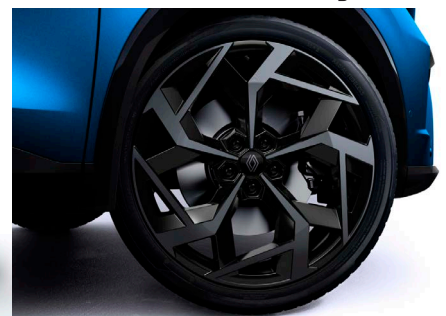
21" könnyűfém CHICANE keréktárcsa