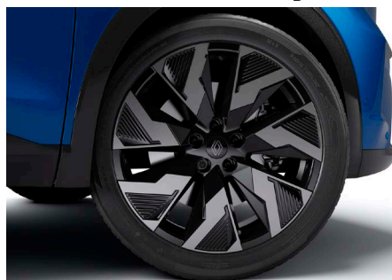
20" könnyűfém CASTELLET keréktárcsa