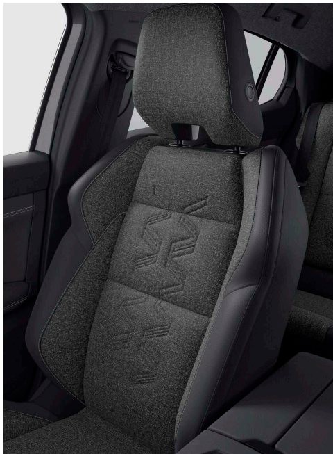
Sötét szövet üléskárpit természetes forrásokból származó műbőr betétekkel