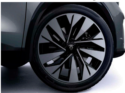
20" könnyűfém SONIC keréktárcsa