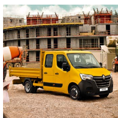
Plató - duplakabin