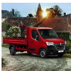
Plató - szimplakabin