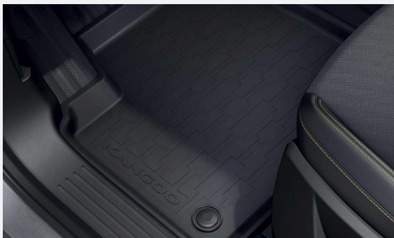
Hattyúnyakas vonóhorog, gumiszőnyeg