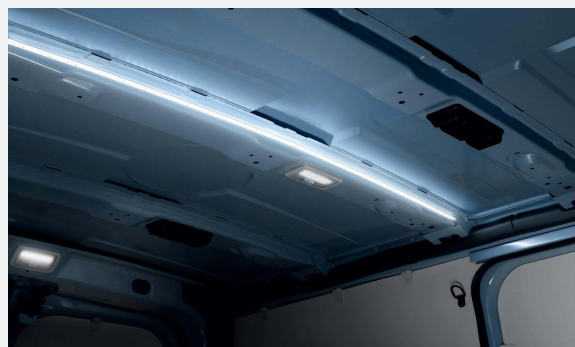
LED csomagtér világítás