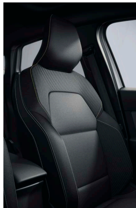
techno kárpitozás sárga varrással