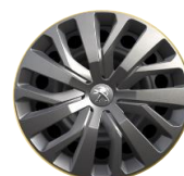
Dísz tárcsa - TONGARIRO 16"*