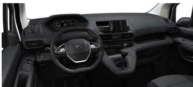
Vezetőhely (alap konfiguráció)