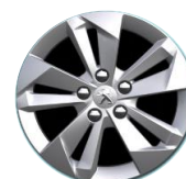
Alumínium keréktárcsa - TARANAKI 16"