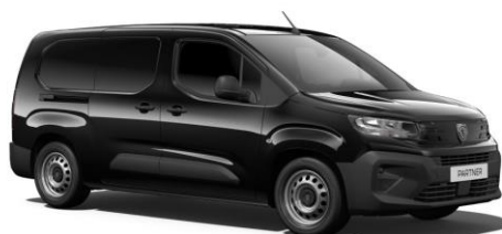
PERLA NERA fekete