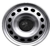
Felni közép "DEMI STYLE" 16"