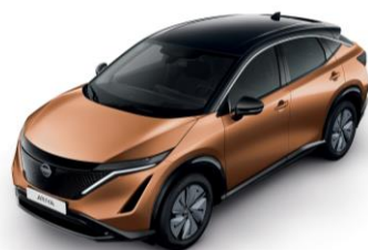
AKATSUKI RÉZ /FEKETE XGJ – 400 000 Ft