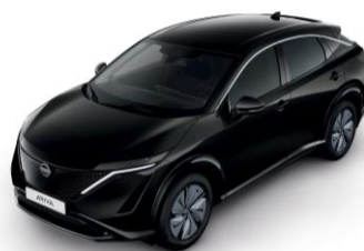
GYÖNGYHÁZFEKETE GAT – 200 000 Ft