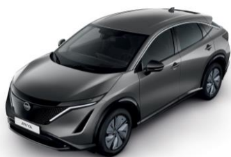
FEGYVERSZÜRKE KAD – 200 000 Ft