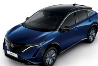
ÉJKÉK /FEKETE XGU – 400 000 Ft