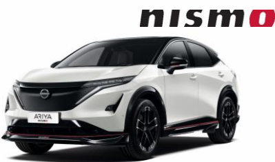
GYÖNGYHÁZFEHÉR /FEKETE XGA – 400 000 Ft