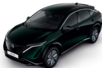
AURORAZÖLD DAP – 200 000 Ft