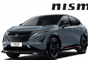
LOPAKODÓ SZÜRKE /FEKETE YAZ – 400 000 Ft