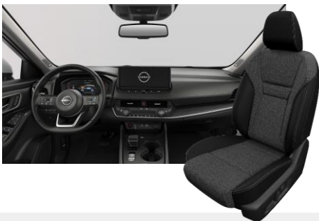
FEKETE SZÖVET ÜLÉSEK [G]