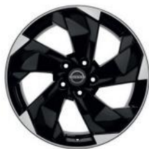
18"-OS KÖNNYŰFÉM KERÉKTÁRCSÁK