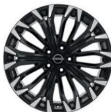
19"-OS KÖNNYŰFÉM KERÉKTÁRCSÁK