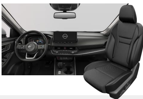
FEKETE SZÖVET ÉS SZINTETIKUS BŐRÜLÉSEK [G]