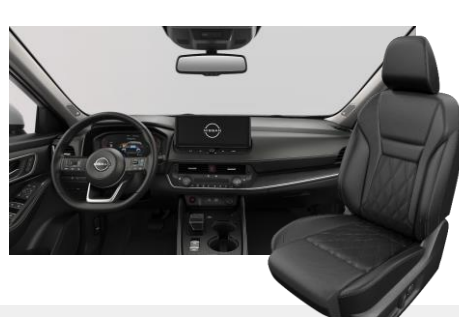
FEKETE NAPPABŐR ÜLÉSEK [G]