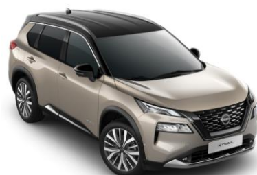
Pezsgő ezüst - Fekete XEW – 450 000 Ft