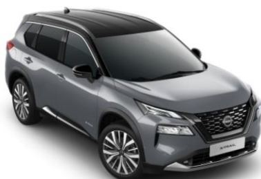
Gyöngyházzsürke - Fekete XEX – 450 000 Ft