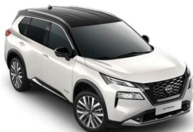
Gyöngyházfehér - Fekete XKJ – 450 000 Ft