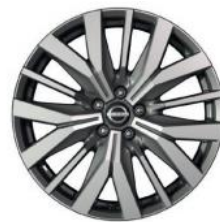
20"-OS KÖNNYŰFÉM KERÉKTÁRCSÁK (Opció)