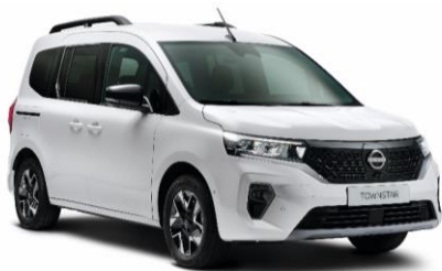
Fehér QNG – 0 Ft