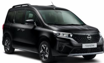
Enigma fekete GNE – 165.100 Ft