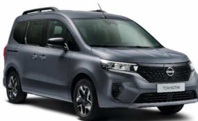
Szürke KPW – 88.900 Ft