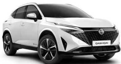
Gyöngyházfehér QBE – 240 000 Ft