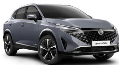
Gyöngyházzsürke KBY – 240 000 Ft