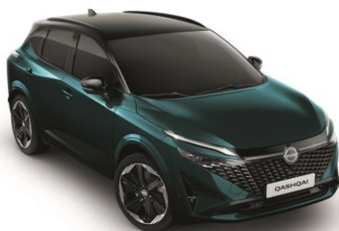
Mélyóceán & Fekete YBJ – 500 000 Ft