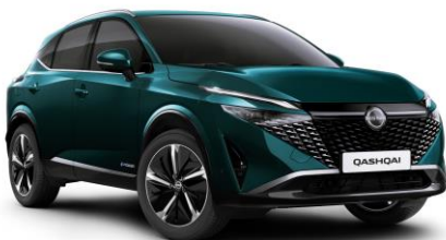
Mélyóceán FAP – 240 000 Ft