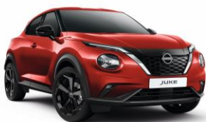
Piros Z10 - 0 Ft