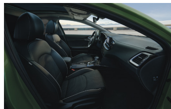
Vegán bőr/textil kárpitozás GOLD és PLATINUM felszereltséghez (CPB fehér varrással)