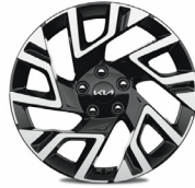
18" könnyűfém keréktárcsa (sztenderd GOLD SPORT, PLATINUM felszereltségekhez)