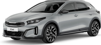
Wolf Grey (WAF) Prémium Metál csak Gold Sport-hoz elérhető