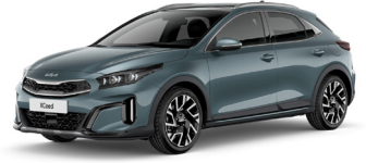
Yuca Steel Gray (USG) GT-Linehoz nem elérhető