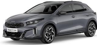
Lunar Silver (CSS) Metál