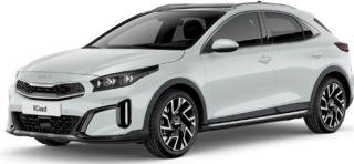
Deluxe White (HW2) Metál