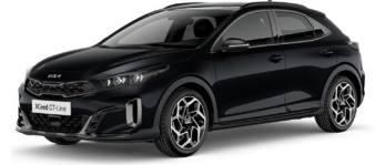
Black Pearl (1K) Metál