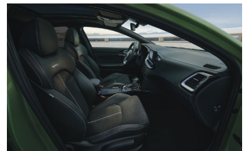
Opcionális BŐR csomag GT-Line felszereltséghez