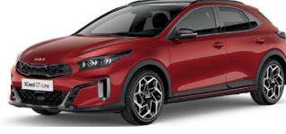
Magma Red (ARD) Prémium Metál