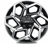
18" könnyűfém keréktárcsa (sztenderd GT-LINE felszereltséghez)