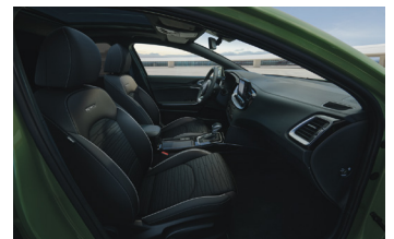
Sportos szintetikus bőr/szövet ülések GT-Line felszereltséghez