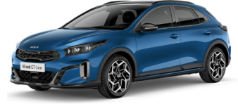
Blue Flame (B3L) Prémium Metál