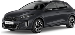
Penta Metal (H8G) Metál