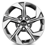
16" könnyűfém keréktárcsa (sztenderd ESSENCE, GOLD felszereltségekhez)