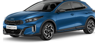
Blue Flame (B3L)