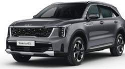
Steel Grey (KLG) METÁL