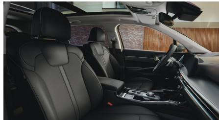
PLATINUM PRO, KRYPTONITE opcionális fekete bőr