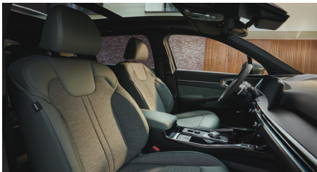
ESSENCE, PLATINUM, PLATINUM PRO, KRYPTONITE sztenderd vegánbőr-szövet