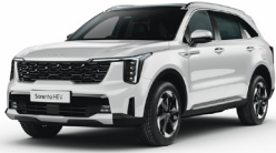
Snow White Pearl (SWP) PRÉMIUM METÁL