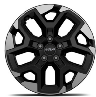
18" könnyűfém keréktárcsa (XK)