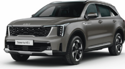
Volcanic Sand (BN4) PRÉMIUM METÁL