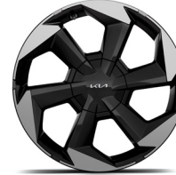
19" könnyűfém keréktárcsa (XM)