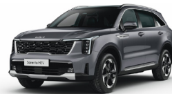
Steel Grey (KLG) METÁL