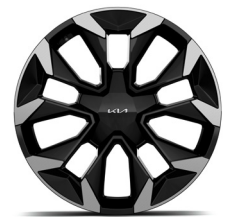
20" könnyűfém keréktárcsa (UV)