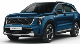
Mineral Blue (M4B) PRÉMIUM METÁL