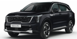
Aurora Black Pearl (ABP) METÁL