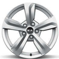
17" könnyűfém keréktárcsa (VA)