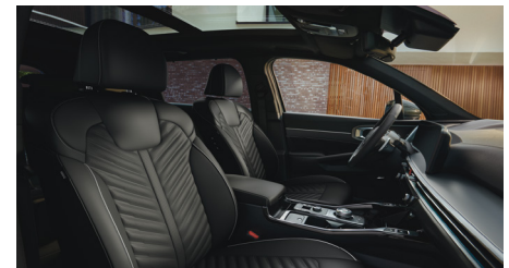
KRYPTONITE opcionális fekete Nappa bőr