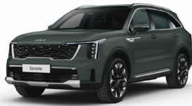
Cityscape Green (CGE) METÁL