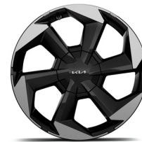
19" könnyűfém keréktárcsa (XM)