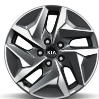
17" könnyűfém keréktárcsa (VB)