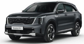
Interstellar Gray (AGT) PRÉMIUM METÁL