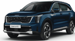
Gravity Blue (B4U) PRÉMIUM METÁL