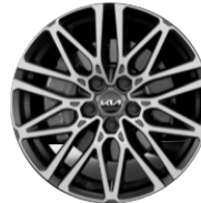
Könnyűfém keréktárcsa 18"