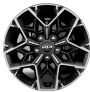
Könnyűfém keréktárcsa 17"