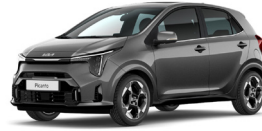
Astro Grey (M7G) Metál