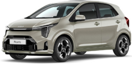
Milky Beige (M9Y) Prémium Metál