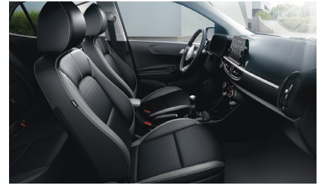
GT LINE sztenderd fekete szintetikus bőr kárpit