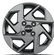
GOLD PLUS (opciós) 14" könnyűfém keréktárcsa