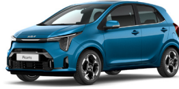
Sporty Blue (SPB) Prémium Metál