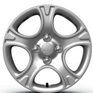
GOLD 14" acél keréktárcsa díszláccsal