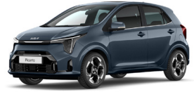
Smoke Blue (EU3) Prémium Metál