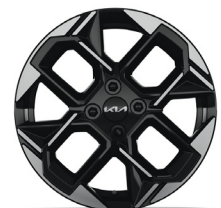
GT LINE 16" könnyűfém keréktárcsa