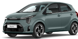
Adventurous Green (A2G) Prémium Metál