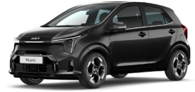
Aurora Black Pearl (ABP) Metál