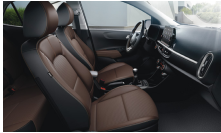
BROWN opciós (PLATINUM felszereléshez) szintetikus bőr kárpit