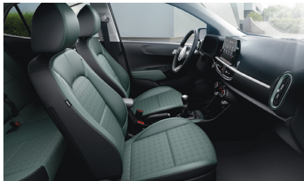
ADVENTUROUS GREEN opciós (GT-LINE felszereléshez) szintetikus bőr kárpit