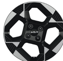
PLATINUM 16" könnyűfém keréktárcsa