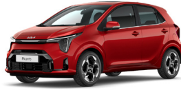
Signal Red (BEG) Prémium Metál