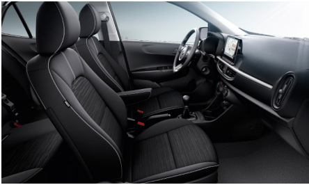
GOLD / PLATINUM sztenderd fekete szövet kárpit