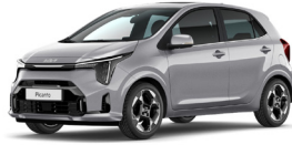
Sparkling Silver (KCS) Metál