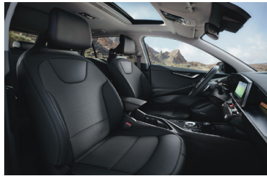
GOLD / PLATINUM fekete szintetikus bőr - szövet kárpit (sztenderd)