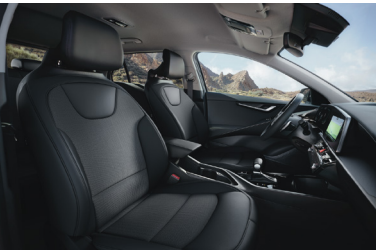
SILVER fekete szövet kárpit (sztenderd)