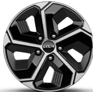
16" alumínium keréktárcsa