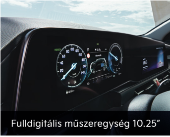
Fulldigitális műszeregység 10.25"