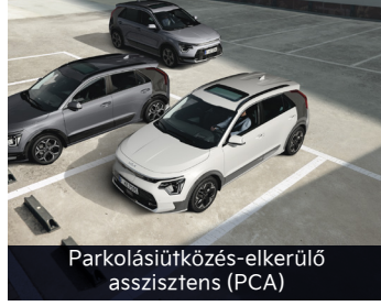
Parkolásiútközés-elkerülő asszisztens (PCA)