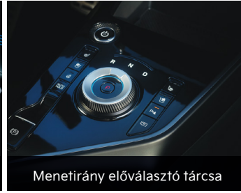
Menetirány előválasztó tárcsa