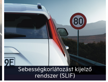
Sebességkorlátozást kijelző rendszer (SLIF)