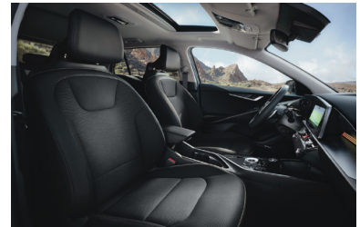
KRYPTONITE fekete szintetikus bőr kárpit (sztfender választható)