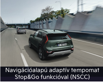
Navigációalapú adaptív tempomat Stop&Go funkcióval (NSCC)