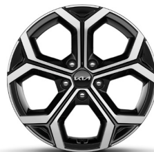
18" alumínium keréktárcsa