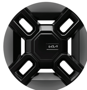
LAUNCH GT-LINE 21" keréktárcsa