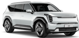
Snow White Pearl (SWP) Prémium Metál