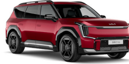
Flare Red (C7R) alapfényezés