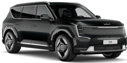
Aurora Black Pearl (ABP) Metál