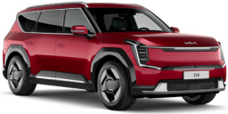
Flare Red (C7R) alapfényezés