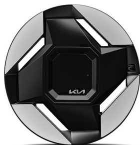
LAUNCH EARTH 19" keréktárcsa