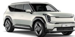
Ivory Silver (ISG) Prémium Metál