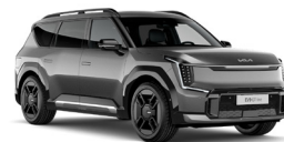
Pebble Gray (DFG) Metál