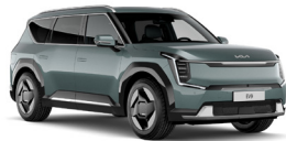
Iceberg Metal (IEG) Metál