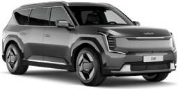
Pebble Gray (DFG) Metál