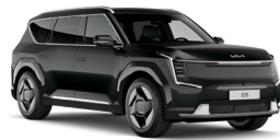
Aurora Black Pearl (ABP) Metál