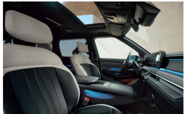
LAUNCH GT-LINE Törtfehér - Fekete (RBQ)