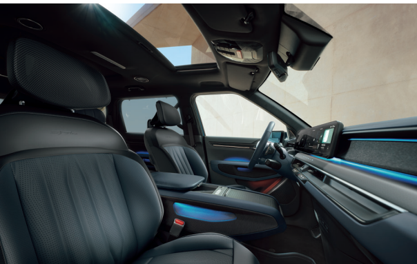
LAUNCH GT-LINE Grafit - Tengeréskék (NJR)