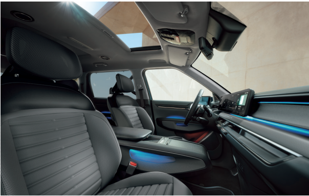
LAUNCH EARTH Fekete - Grafit (RBQ)