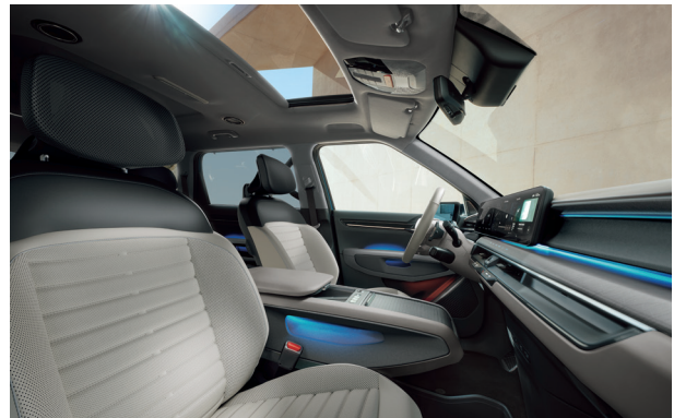
LAUNCH EARTH Grafit - Szignálszürke (EMA)