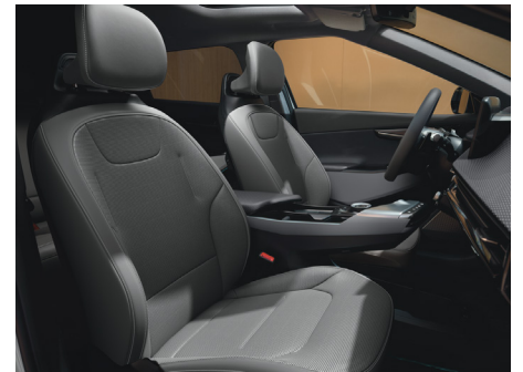
EARTH Vegánbőr ülésárpit (Törtszürke - DFS)