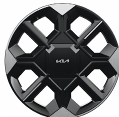
EARTH 20" keréktárcsa (UJ) opció