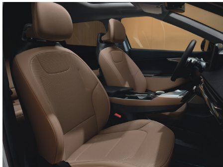
EARTH Vegánbőr ülésárpit (Lattebarna - CRJ)