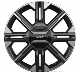
GT-LINE 20" keréktárcsa (VE) opció