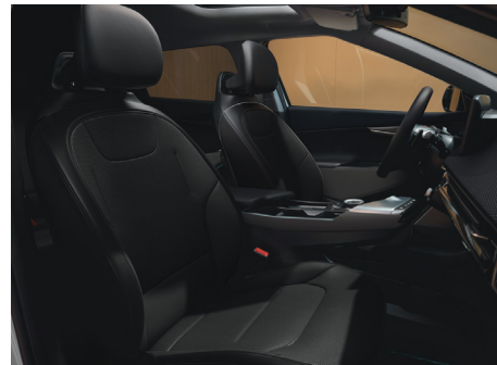
EARTH Vegánbőr ülésárpit (Bazaltfekete - WK)