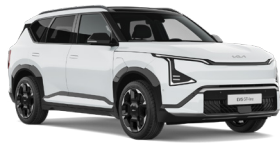
Snow White (SWP) (Metál)