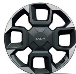
GT-LINE 19" keréktárcsa (YB)