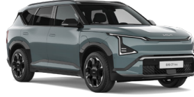
Iceberg Green (IEG) (Prémium metál)