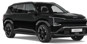
Fusion Black (FSB) (Metál)