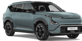
Iceberg Green (IEB) (Matt)