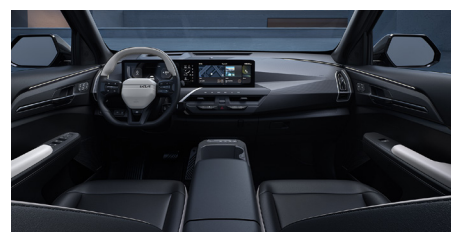
GT-LINE Vegán bőrlélek (2Tone)