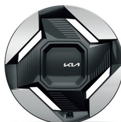
EARTH 19" keréktárcsa (YA) opciós