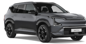
Gravity Grey (KDG) (Metál)