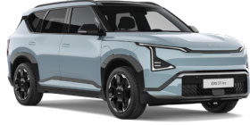
Frost Blue (EBB) (Alap szín)