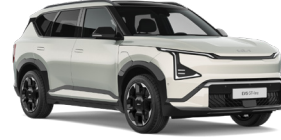
Ivory Silver (ISG) (Prémium metál)