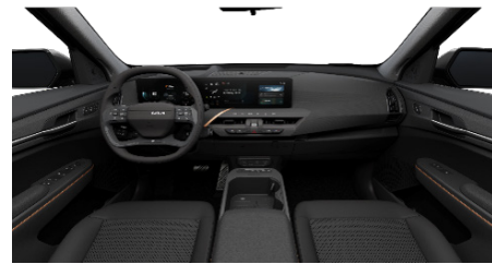
EARTH Vegán bőr és szövet üléskárpit (Bazalfekete)