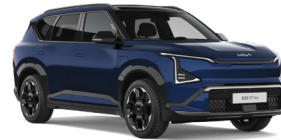
Dark Ocean Blue (BU3) (Prémium metál)