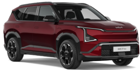
Magma Red (OVR) (Prémium metál)