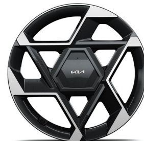
19" könnyűfém keréktárcsa (XP) GT-Line