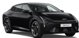
Aurora Black Pearl (ABP) (Metál)