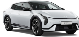
Snow White (SWP) (Metál)