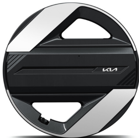
17" könnyűfém keréktárcsa (VA) Earth / Earth Plus