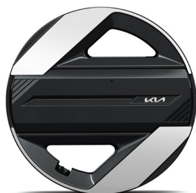
17" könnyűfém keréktárcsa (VA) Earth / Earth Plus