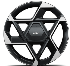
19" könnyűfém keréktárcsa (XP) GT-Line