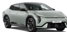
Morning Haze (ACW) (Prémium Metál)