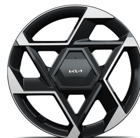
19" könnyűfém keréktárcsa (XP) GT-Line