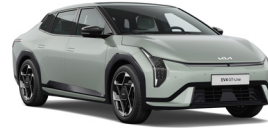
Morning Haze (ACW) (Prémium Metál)