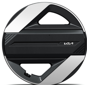
17" könnyűfém keréktárcsa (VA) Earth / Earth Plus