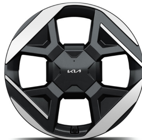
19" könnyűfém keréktárcsa (XM) Earth Plus opció