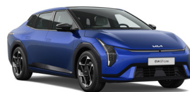
Yach Blue (ACX) (Prémium Metál)