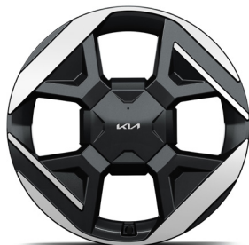
19" könnyűfém keréktárcsa (XM) Earth Plus opció