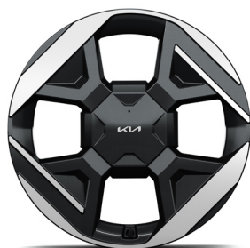
19" könnyűfém keréktárcsa (XM) Earth Plus opció