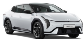
Snow White (SWP) (Metál)