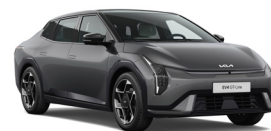
Shale Grey (EBD) (Metál)