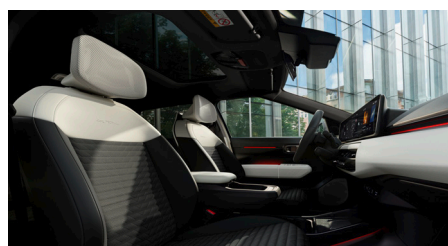
GT-LINE Vegán bőrlélek