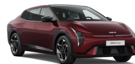
Magma Red (OVR) (Prémium Metál)