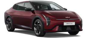
Magma Red (OVR) (Prémium Metál)