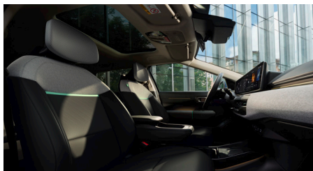
EARTH PLUS Fekete Vegán bőr szövet üléskárpit