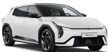
Casa White (WD) Alapszín