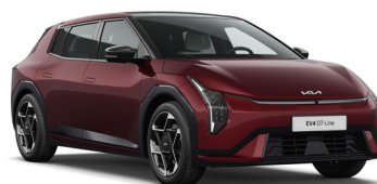
Magma Red (ARD) Prémium metál