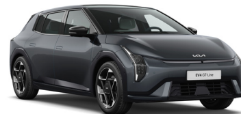
Penta Metal (H8G) Metál