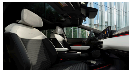
GT-LINE Vegán bőrlülések