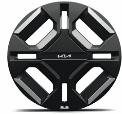
19" keréktárcsa (XP)