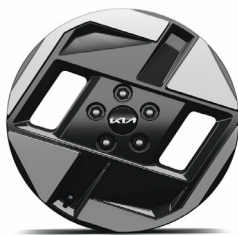
17" keréktárcsa (VA)