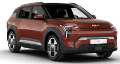
Terra Cotta (TCT)