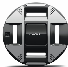
19" keréktárcsa (XM)