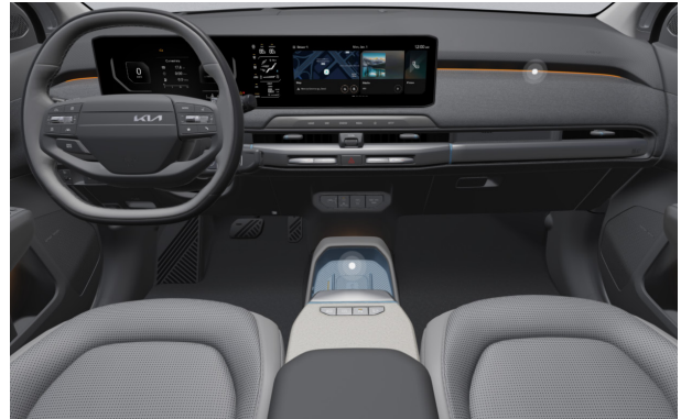
EARTH PLUS - sztenderd szürke 2tone vegán bőr üléskárpit - ELG (Blue díszbetéttel)