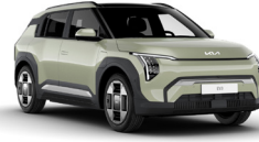
Aventurine Green (AG3)