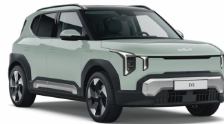
Morning Haze (DM8) Prémium metál