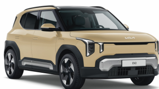
Vanilla Blossom (L3Y) Prémium Metál (GT-line-hoz nem elérhető)