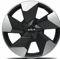
18" könnyűfém keréktácsa (XA) Earth szterder