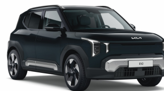
Black Pearl (1K) Metál (GT-line-hoz nem elérhető)