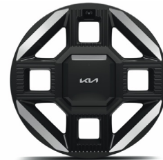
19" könnyűfém keréktácsa (XM) GT-Line szterder

* Felhívjuk szíves figyelmüket, hogy a Kia EV2 típusú modellünk jelenlegi árlistán közölt műszaki adatai (köztük az elektromos hatótáv, elektromosenergia-fogyasztási és raktérméretekkal kapcsolatos adatai) és felszereltsége eltérhetnek a gépkocsi homologizációs eljárása során későbbiekben rögzített végleges adatoktól. A fentiek alapján tehát jelen dokumentumban közölt műszaki adatok nem minősülnek ajánlattételnek, azok célja kizárólag tájékoztató jellegű.