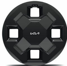
16" könnyűfém keréktárcsa (MA) Air sztenderd