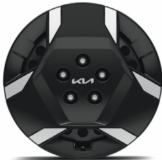
16" acél keréktárcsa dísztárcsával (1F) Light sztenderd