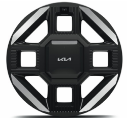
19" könnyűfém keréktárcsa (XM) GT-Line sztenderd

* Felhívjuk szíves figyelmüket, hogy a Kia EV2 típusú modellünk jelenlegi árlistán közölt műszaki adatai (köztük az elektromos hatótáv, elektromosenergia-fogyasztási és raktérméretekről kapcsolatos adatai) és felszereltsége eltérhetnek a gépkocsi homologizációs eljárása során későbbiekben rögzített végleges adatoktól. A fentiek alapján tehát jelen dokumentumban közölt műszaki és felszereltségi adatok nem minősülnek ajánlattételnek, azok célja kizárólag tájékoztató jellegű.