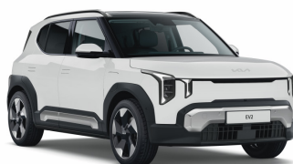
Cassa Wide (WD) Alapszín (GT-line-hoz nem elérhető)