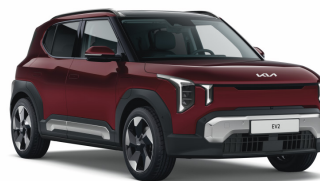
Magma Red (ARD) Prémium metál