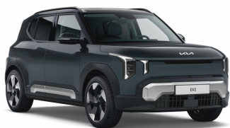
Penta Metál (H8G) Metál (alapszín GT-Line)