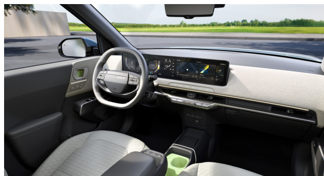
Earth - Mélyszürke + Vászonzécs (CPB) szövet üléskárpit (opciós)