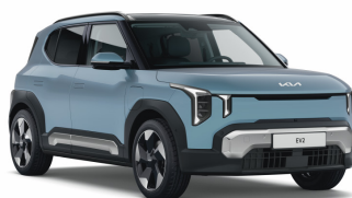
Frost Blue (EBU) Prémium metál