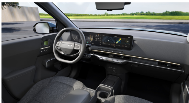
Light, Air és Earth - Mélyszürke szövet üléskárpit (sztenderd)