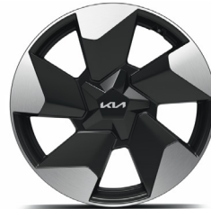
18" könnyűfém keréktárcsa (XA) Earth sztenderd