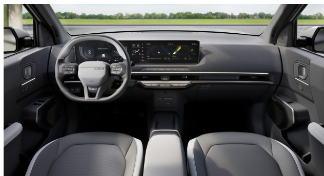
GT-Line - 2Tone vegan bőr üléskárpit (sztenderd)