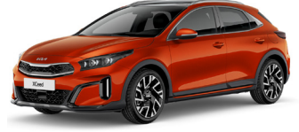
Orange Fusion (RNG) GT-Linehoz nem elérhető