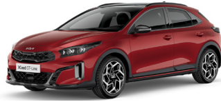
Infra Red (AA9)