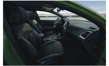
Sportos szintetikus bőr/szövet ülések GT-Line felszereltséghez