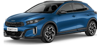
Blue Flame (B3L)