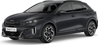
Penta Metal (H8G)