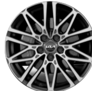
Könnyűfém keréktárcsa 18"