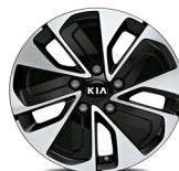
Könnnyűfém keréktárcsa 16" GOLD PLUS csomaghoz