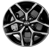
Könnnyűfém keréktárcsa 17" PLATINUM, FUSION PLUS