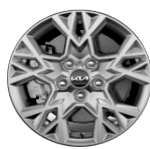
Könnnyűfém keréktárcsa 16" GOLD