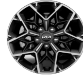
Könnnyűfém keréktárcsa 17" PLATINUM GT LINE GOLD SPORT