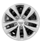
Acél keréktárcsa 15" SILVER, FUSION