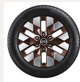
18" könnyűfém keréktárcsák (Luxury 7 személyes)