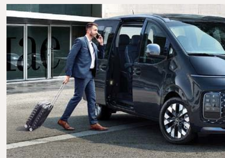
Elektromosan csúsztatható ajtók