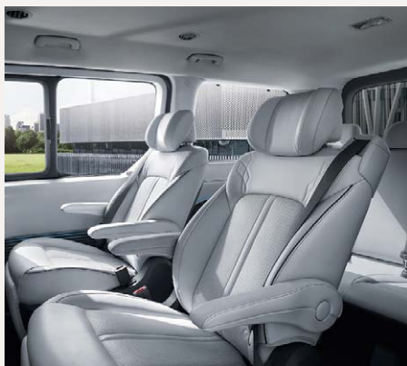
Luxury 7 személyes