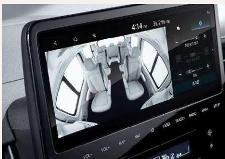
Audióvizuális kapcsolattartás a hátsó utasokkal