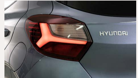
LED-es hátsó lámpák