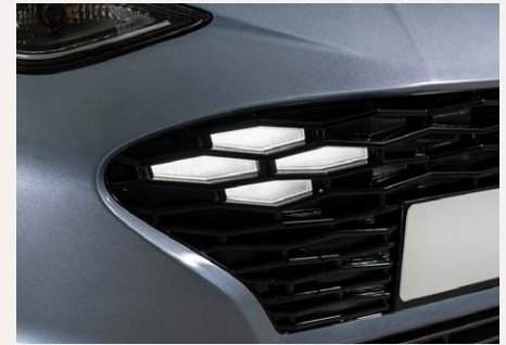
LED-es nappali menetfény