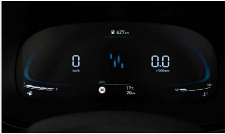
4,2"-os Supervision műszeregység