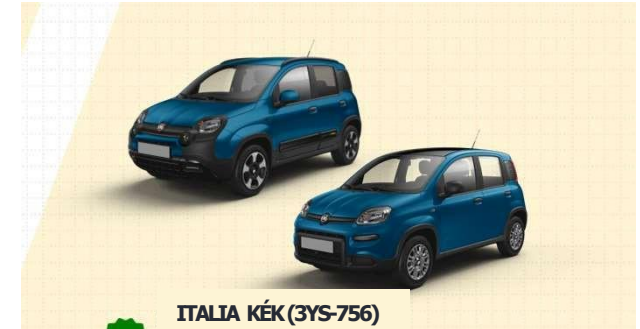
ITALIA KÉK (3YS-756)