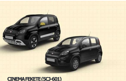
CINEMA FEKETE (5CJ-601)