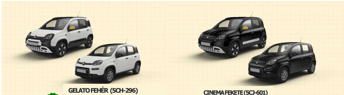
GELATO FEHÉR (5CH-296)