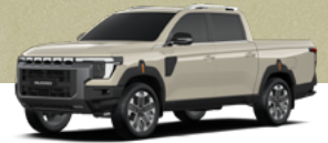
EBK – SAND BEIGE homok