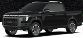
LAK – SPACE fekete