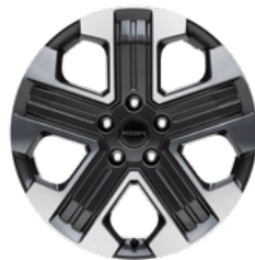
20" Diamond-Cut könnyűfém keréktársák