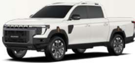
WAA – GRAND fehér