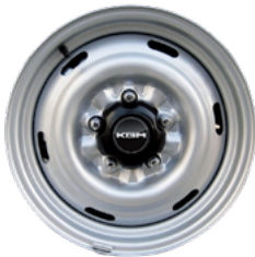
17" acél keréktársák