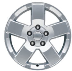
18" könnyűfém keréktársák