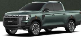
GAM – AMAZONIA zöld