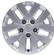
17" könnyűfém keréktársák