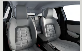
Alcantara Grey beltérhangulat (MAX-on opció)