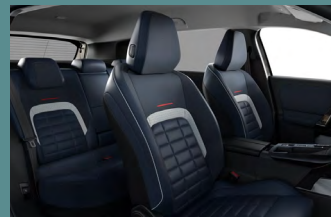
Hype Blue beltérhangulat (MAX)