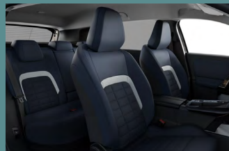
Metropolitan Blue beltérhangulat (PLUS)