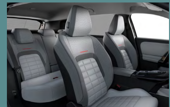
Hype Grey beltérhangulat (PLUS-on és MAX-on opció)