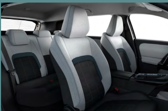
Urban Grey beltérhangulat (YOU)

A C5 AIRCROSS – felszereltségtől függően – a következő beltérhangulatokkal érhető el