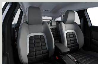
Metropolitan Grey beltérhangulat (MAX)