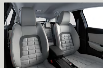
Alcantara Grey beltérhangulat (MAX-on opció)